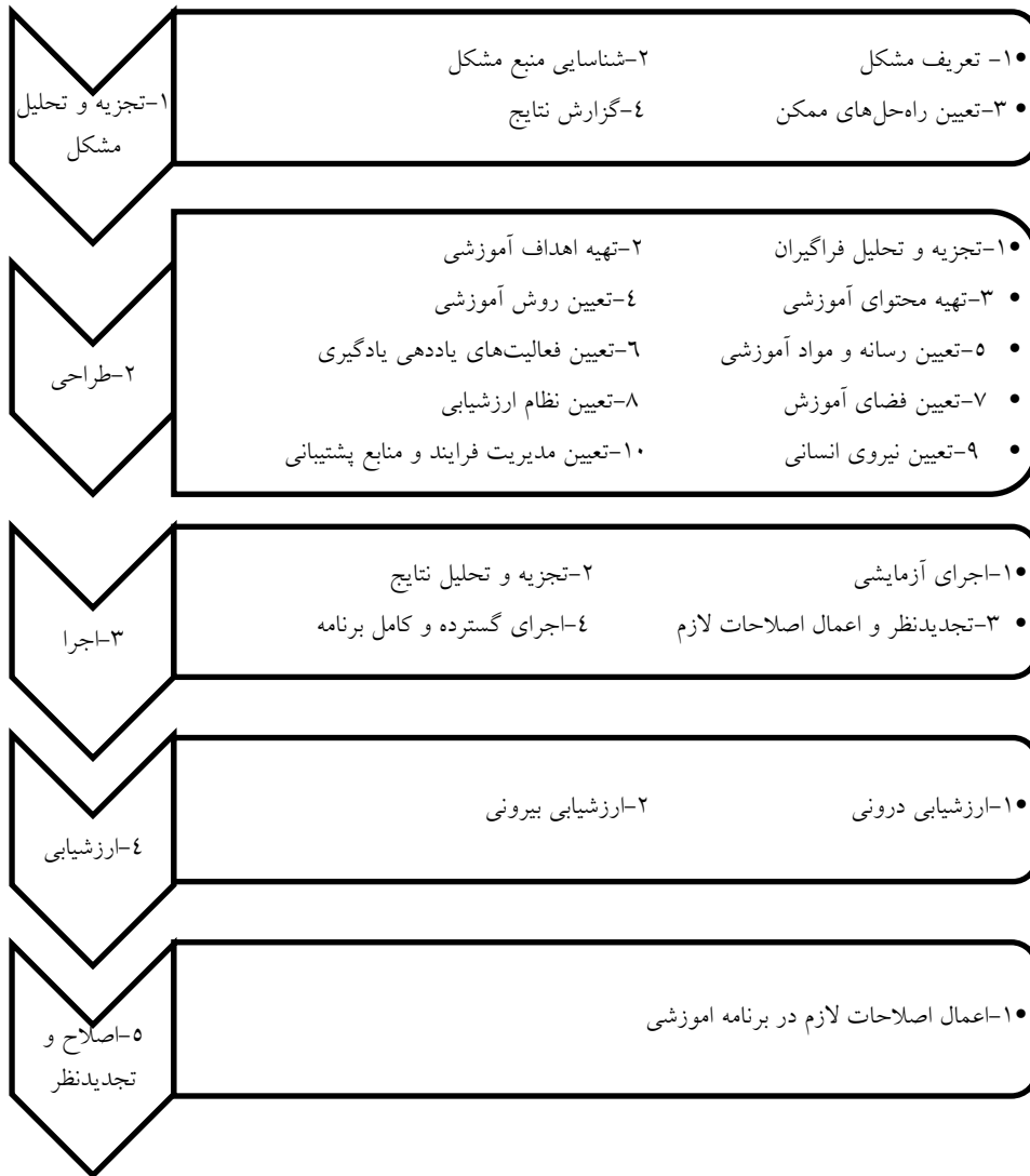
شکل ۱. مدل طراحی آموزشی و محیط‌های یادگیری زارعی زوارکی

گردآوری اطلاعات در سه مرحله انجام شد: ابتدا با توجه به مدل فعالیت‌های تلفیقی (شکل شماره ۱ مدل زارعی زوارکی (۱۳۹۱))، مرحله‌ی اول؛ یعنی اصل تجزیه و تحلیل مشکل و سپس طراحی انجام شد: